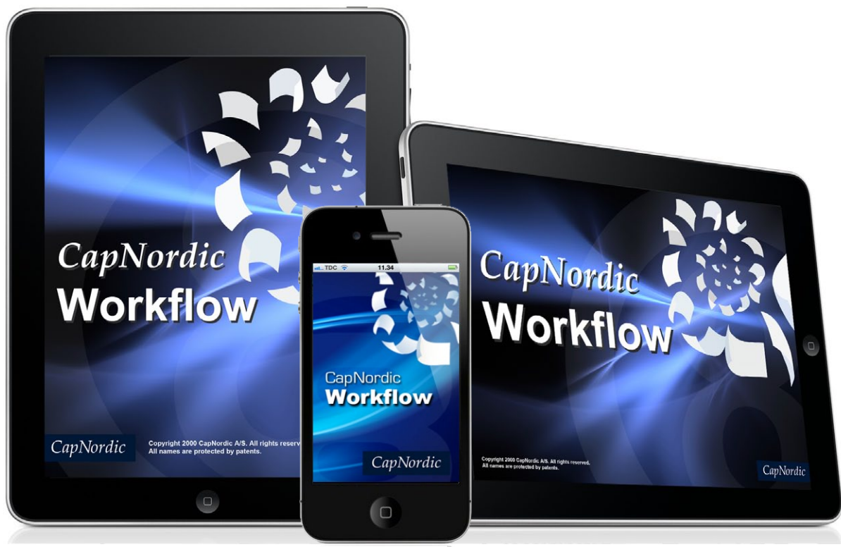
Applikation virker til både: iPhone, iPad og iPad Mini

Kontakt din konsulent for yderligere information og priser på produktet.