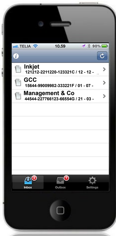
Den nye Applikationen fører brugeren direkte til indbakke

Workflow App giver brugeren en større frihed og råderum. Den er let at administrere, mindre tidskrævende og altid lige ved hånden.