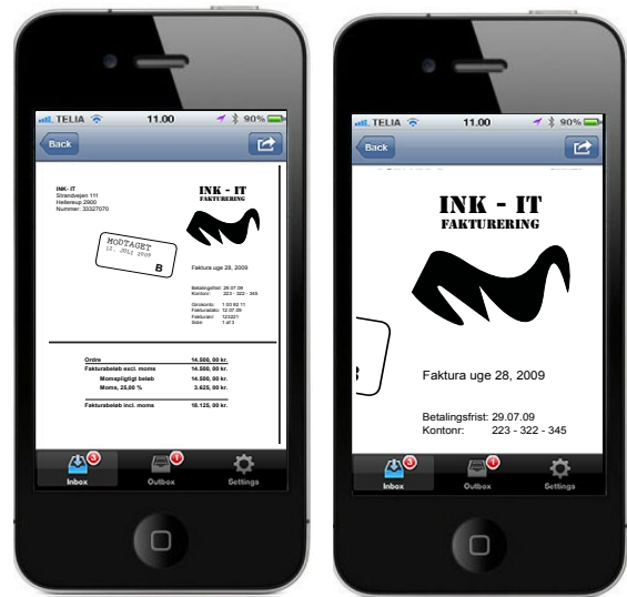
Brugeren kan ligesom på PC se fakturaen, og zoom ind for at se flere detaljer

Interfacet er anderledes end på PC og viser blot de indgående fakturaer der ligger til godkendelse i indbakken, processen på fakturaerne og indstillinger. Det er simpelt, til at forstå og lige til at benytte. Som noget ekstra byder applikationen på en printerfunktion, der tillader brugeren at forbinde sig en printer i nærheden og printe direkte fra iPhone.