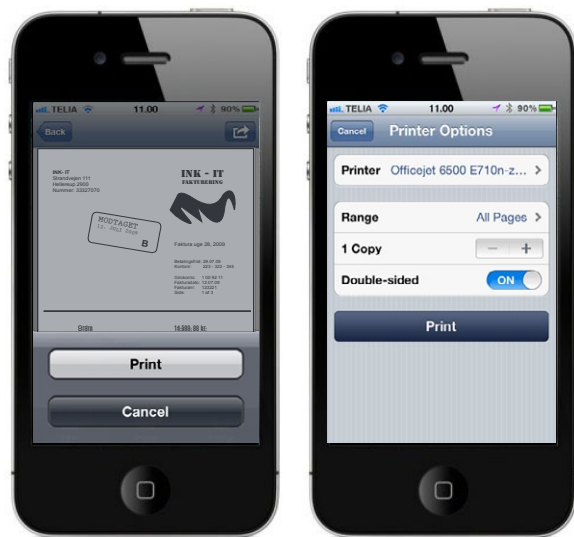
Brugeren kan via applikationen tilføje en printer og printe fakturaen direkte fra telefonen